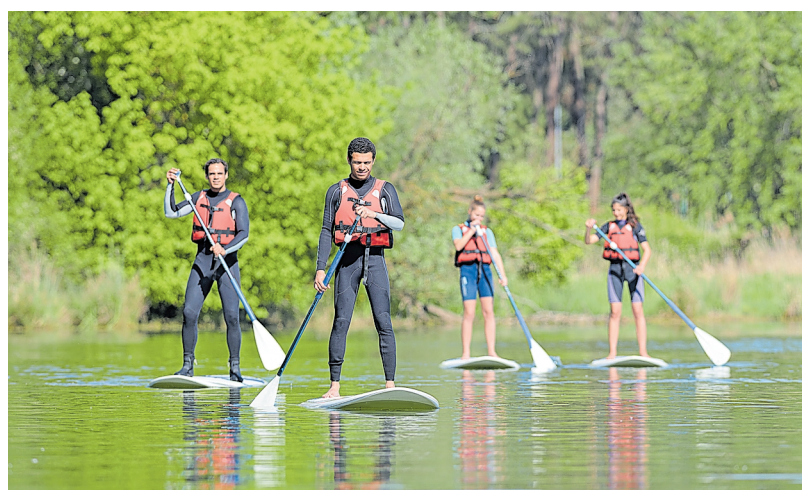
Das Gleichgewicht und die Geschicklichkeit können auf einem Stand-Up-Paddle auf dem Kocher getestet werden.

In Niedernhall auf dem Firmengelände von Würth Elektronik wird sich alles um das Thema Rad drehen, unter anderem mit einer Lauftrad-Challenge und einer Waschstraße für Räder. Zudem wird der Nahverkehr Hohenlohekreis (NVH) an einem Stand über das Deutschland-Ticket