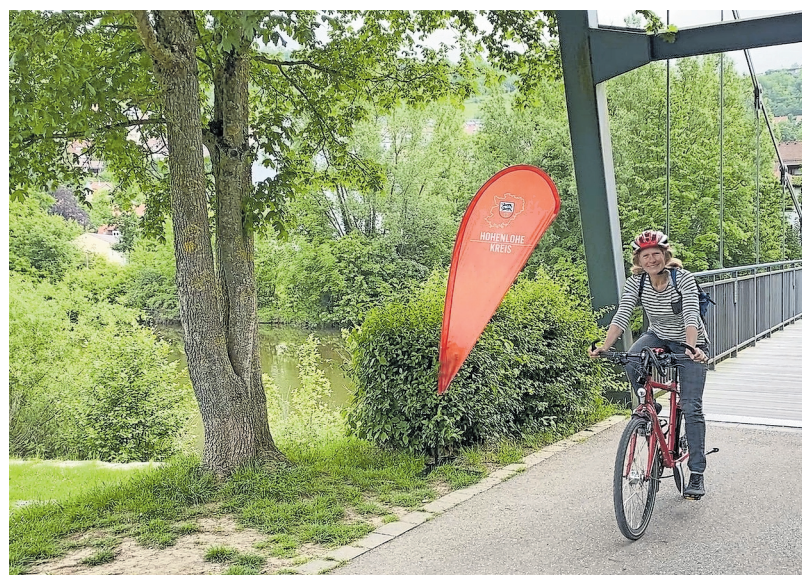
Beim Stadtradeln können alle Bürgerinnen und Bürger im Hohenlohekreis mitmachen. Dabei ist egal, ob mit dem Fahrrad, dem Lastenrad oder einem E-Bike.

Vom 18. Juni bis 8. Juli 2023 sollen wieder möglichst viele Radkilometer gesammelt werden