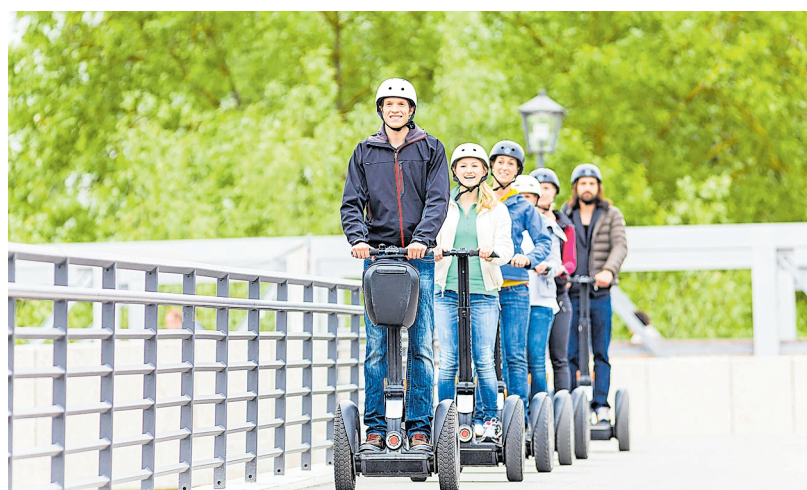
Auf den Wertwiesen in Künzelsau können Besucher ihr Können bei einem Segway-Parcours unter Beweis stellen.

An allen drei Standorten bietet der Nahverkehr Hohenlohekreis speziell