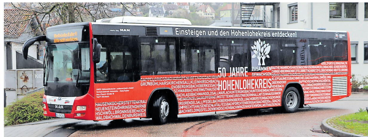
Der Bus mit dem Jubiläumslogo „50 Jahre Hohenlohekreis – Zusammen gewachsen“ fährt das gesamte Jahr durch den Landkreis. Einzelne Namen von Städten, Gemeinden und Ortsteilen verschmelzen dabei zu einem Ganzen.

Auf der anderen Seite des Jubiläumsbusses werden die verschiedenen Ausbildungsmöglichkeiten in der Landkreisverwaltung beworben. Auf einem weiteren Bus ist eine allgemeine Werbung für den Landkreis zu sehen.