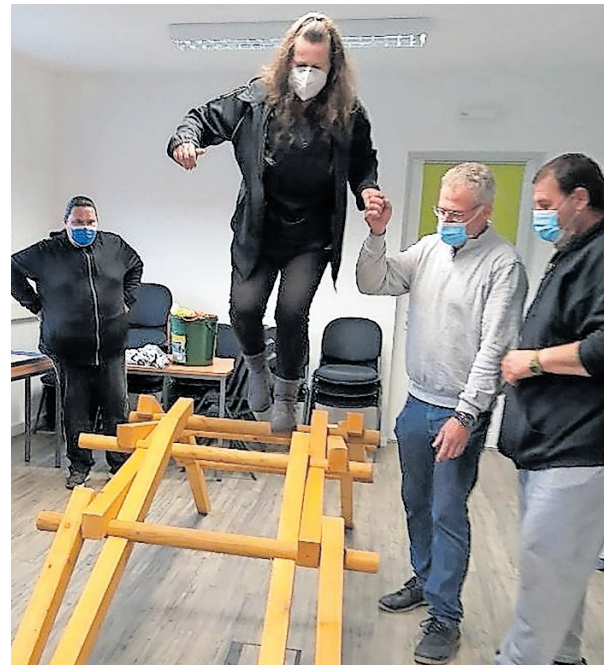
Mit Teamwork aus Einzelteilen eine Brücke bauen ... und dann mutig darüber gehen.