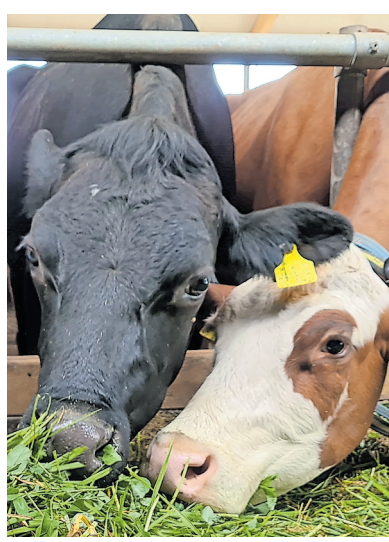
Einblicke in die Milchvieh- und Weideochsenhaltung erhalten Besucherinnen und Besucher bei den stündlichen Betriebsführungen auf dem landwirtschaftlichen Betrieb der Familie Kruck im Unteren Railhof.

Tierhaltung und Pflanzenbau sind die Schwerpunkte der drei landwirtschaftlichen Betriebe auf dem Railhof. Während beim Betrieb Böhm die Schweinezucht und -mast im Mittelpunkt stehen, sind es beim Betrieb Kruck das Milchvieh und die Weideochsen. Beim Betrieb Thierauch dreht sich alles um den Pflanzenbau. Durch Betriebsbegehungen, Einblicke in die Ställe und Informationen rund um die Verwendung und Verarbeitung der Produkte erfahren die Besucherinnen und Besucher, wie vielfältig und aufwendig die Arbeit in den landwirtschaftlichen Betrieben ist. „Wir beteiligen uns gerne an der Gläsernen Produktion. Sind wir doch